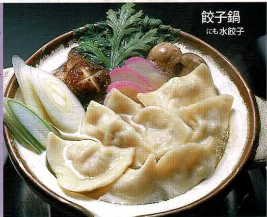
餃子鍋にも水餃子

■調理法は、 チョー簡単 冷凍のまま グツグツ煮 えたお鍋の 中に入れる だけ。